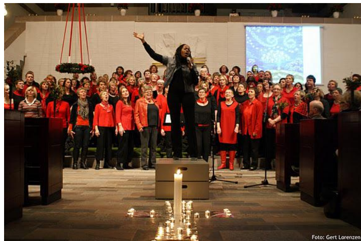
Fra koncerten 2011 med Horne Gospelkor og Kvaglund Kirkes Gospelkor