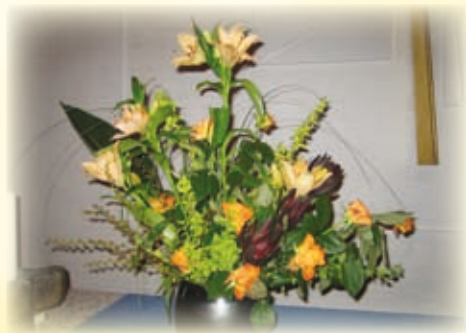
Dekoration på alteret