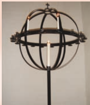
Kirken står åben det meste af dagen. Søg stilhed i kirken! Tænd et lys og bed en bøn!

er de store tankers tid – p.g.a begivenhederne som knytte sig til disse højtider, men også fordi vi får nogle fridage hvor tankene ikke er bundet til dagligdagens krav. Pludselig kan et eller andet stå lysende klart for os. Tør du gå ind i en fase, som kan give nye muligheder, mening og perspektiv i dit liv? Glædelig Jul og godt Nytår!