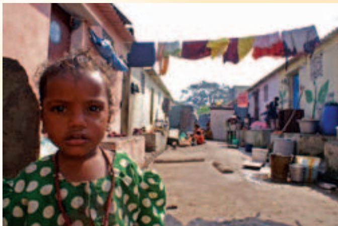
Lille pige fra slumkvarter i Chennai i Indien

Folkekirkenes Nødhjælps Sogneindsamling 2006 søndag den 5. marts