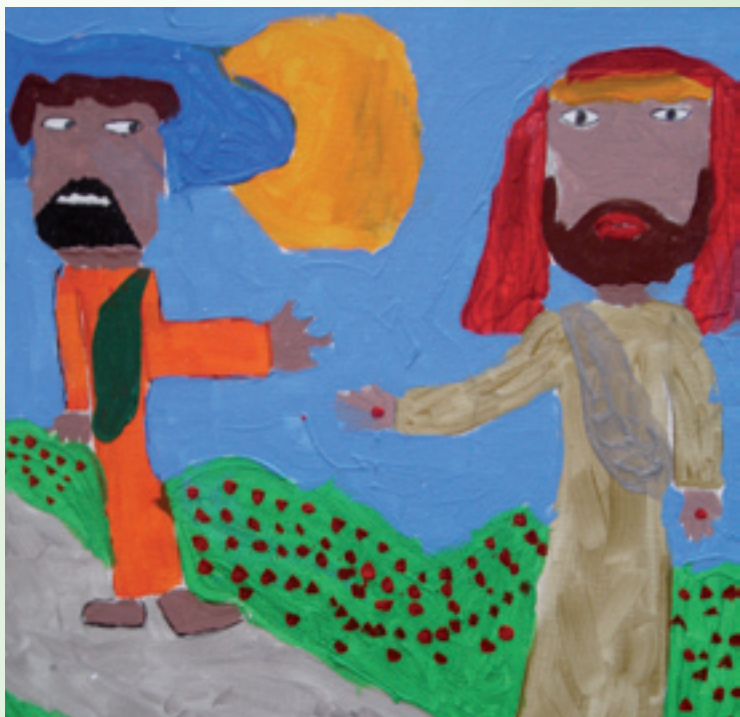
Et af malerierne i den serie som minikonfirmanderne 2005 lavede. Motivet forestiller Jesus, der viser sine hænder med sømmærker til Thomas efter opstandelsen

For at tilmelde sig kan man ringe til 7514 1066 eller 7514 4138 eller sende mail til: jensfn@kvaglundkirke.dk